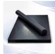
Ketron® MD PEEK