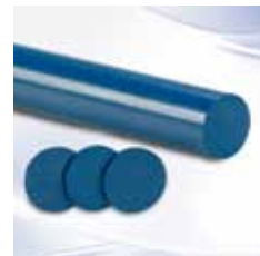
Nylatron® MD Stab/Scheiben