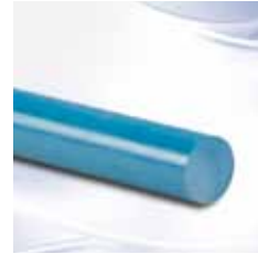
Acetron® MD Stab